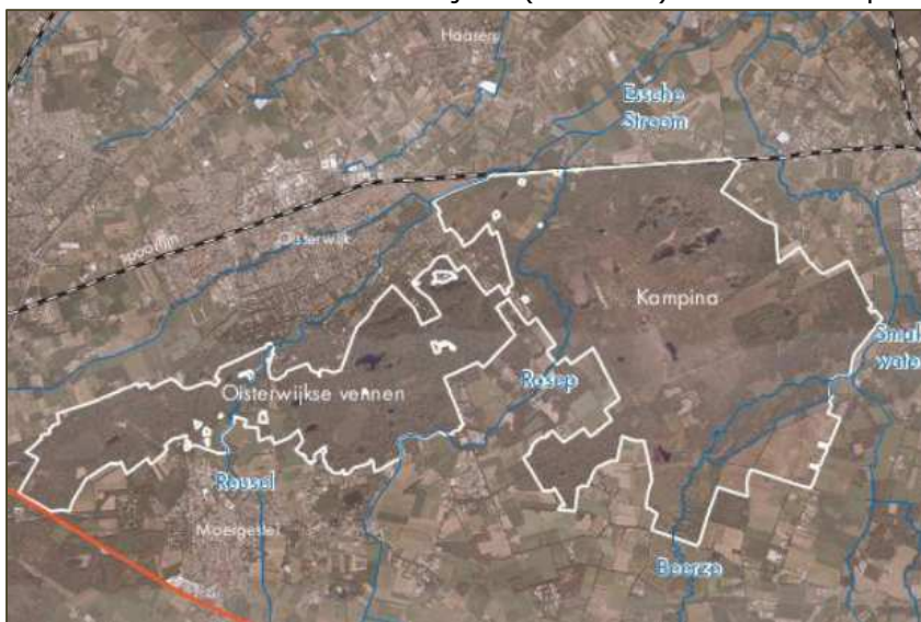
Figuur 4 Gebieden Natura 2000

De beschermingsmaatregel met het grootste effect op de Structuurvisie is de inperking van stikstofdepositie. Deze is in de Programmatische Aanpak Stikstof (PAS) vertaald. Op 1 juli 2015 heeft de provincie naast de algemene wetgeving van de PAS besloten dat er geen extra stikstofdepositie op het Natura 2000 gebied "Kampina & Oisterwijkse Vennen" mag plaatsvinden. Dat heeft een effect op de mogelijkheden voor uitbreiding van veehouderijen, maar ook voor alle andere bedrijven (recreatie) die stikstofdepositie veroorzaken.