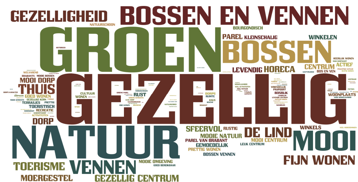
Figuur 2 Positieve punten Oisterwijk

Oisterwijk staat bekend als Parel in 't Groen . De gemeente bestaat uit de kernen Oisterwijk en Moergestel en buurtschap Heukelom. Hier is het prettig wonen. Voor de Structuurvisie zijn bewoners en instanties benaderd en gevraagd om hun mening te geven over Oisterwijk. Het zijn met name de groene elementen van de gemeente, die hoog gewaardeerd worden, samen met de sfeer in de gemeente (gezellig). Zowel de natuur in het buitengebied als het ruime open en groene woonklimaat in de kernen worden genoemd onder de noemer Groen.